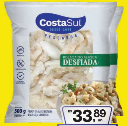
Polaca Costa Sul Desfiada Cong. 500g 33,89 , un. Pagando com VUONICARD 29,89 , un.