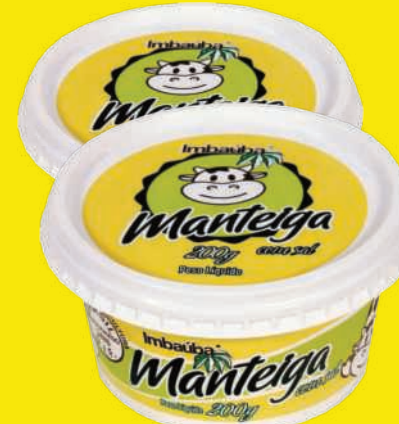
Manteiga Imbaúba Pote 200g 11,39 , un.