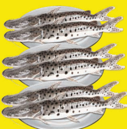
Pintado Inteiro Euiscerado Cong. kg 43,89 , kg