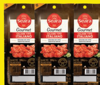
Salame Tipo Italiano Seara Gourmet Fatiado 100g 9,90 , un.