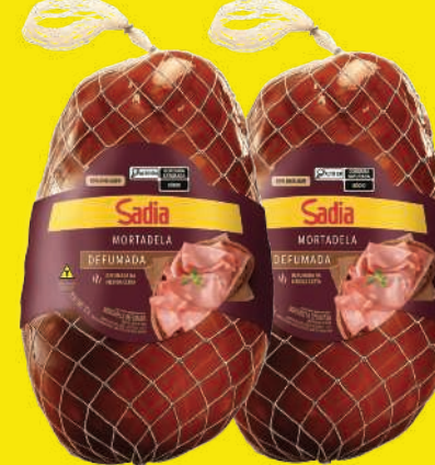
Mortadela Defumada Sadia Defumada kg 19,90 , kg