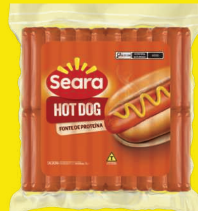
Salsicha Hot Dog Seara Cong. 5kg 44,90 , un.