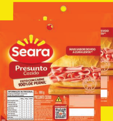
Presunto Seara Fatiado 180g 7,98 , un.