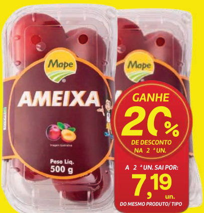
Ameixa Mape 500g 8,99 , un. GANHE 20% DE DESCONTO NA 2ª UN. A 2ª UN. SAÍ POR: 7,19 , un. DO MESMO PRODUTO/ TIPO