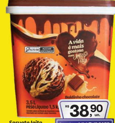
Sorvete Jeito Frio 3,5 Litros Sabores 38,90 , un. Pagando com VUONICARD 37,90 , un.