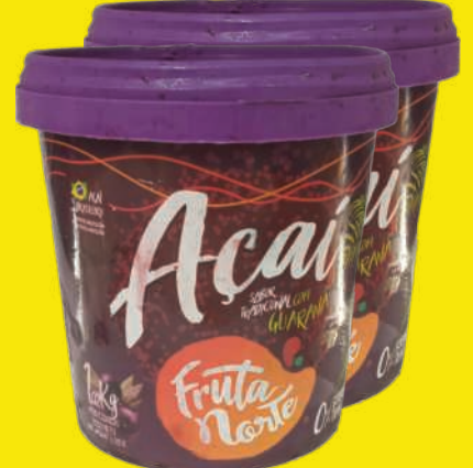
Açaí Fruta Norte Tradicional 1,02kg 26,90 , un.