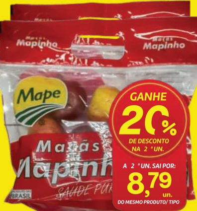
Maçã Mape Mape Pacote 850g 10,99 , un. GANHE 20% DE DESCONTO NA 2ª UN. A 2ª UN. SAÍ POR: 8,79 , un. DO MESMO PRODUTO/ TIPO