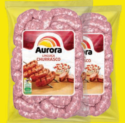
Linguica p/ Churrasco Aurora 5kg 74,90 , un.