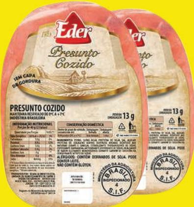
Presunto Eder kg 17,90 , kg