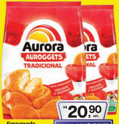
Empanado Aurogets Congelado 900g 20,90 , un. Pagando com VUONICARD 19,90 , un.