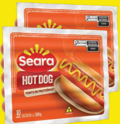
Salsicha Hot Dog Seara 500g 8,98 , un.