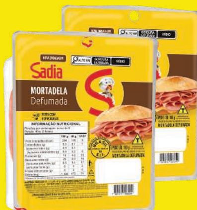
Mortadela Sadia Defumada Fatiada 180g 5,99 , un.