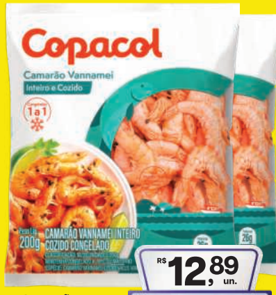
Camarão Vannamei Copacol Inteiro Cong. 200g 12,89 , un. Pagando com VUONICARD 11,89 , un.