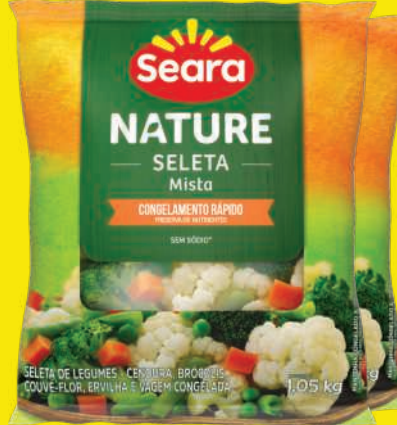
Seleta Mista Seara Nature Cong. 1,05kg 17,90 , un.