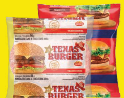
Hambúrguer Bou. Seara ou Rezende Mistão 56g 1,69 , un.

NA COMPRA DE 2 un. +R$0,01 LEVE A 3ª UNIDADE Lasanha Rezende 600g Sabores