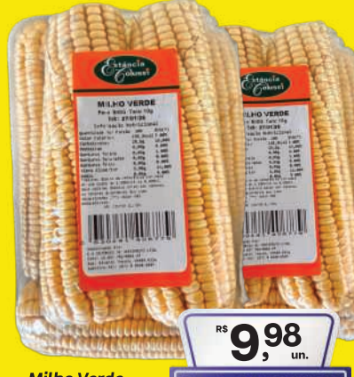
Milho Verde Estância Colussi 800g 9,98 , un. Pagando com VUONICARD 8,98 , un.