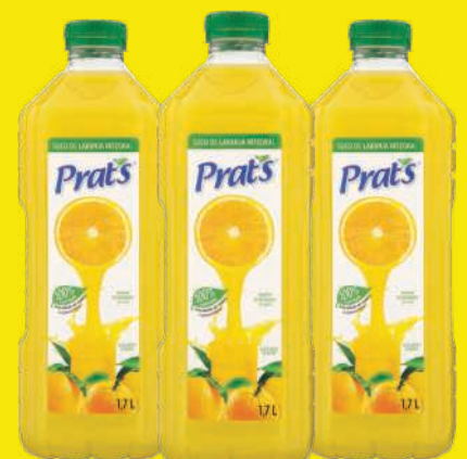
Suco Prats 1,5 Litros 21,98 , un.