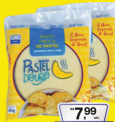
Massa de Pastel D'ouro Disco 400g 7,99 , un. Pagando com VUONICARD 7,49 , un.