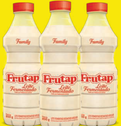
Leite Fermentado Frutap Baunilha 850g 9,98 , un.