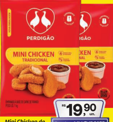
Mini Chicken de Frango Perdigão 1kg 19,90 , un. Pagando com VUONICARD 18,90 , un.

NA COMPRA DE 2 un. +R$0,01 LEVE A 3ª UNIDADE Hamb. Bou. Seara ou Rezende Mistão 56g