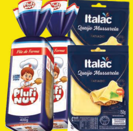
Queijo Mussarela Italic Fat. 150g ou Pão de Forma Plufi Nut 400g 7,99 , un.