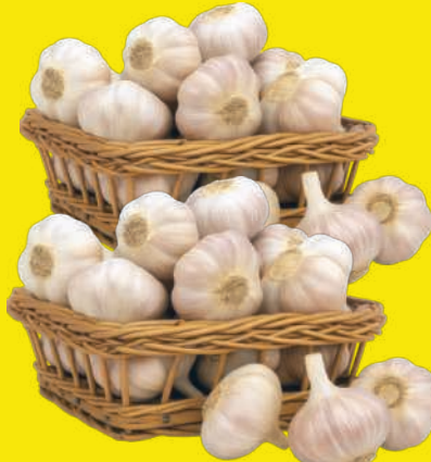
Alho Granel kg 16,90 , kg