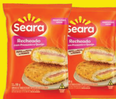
Empanado de Frango Seara Presunto e Queijo Cong. 110g 3,90 , un.