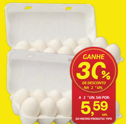
Ovos Brancos Katayama ou Camua c/ 12 un. 7,99 , un. GANHE 30% DE DESCONTO NA 2ª UN. A 2ª UN. SAÍ POR: 5,59 , un. DO MESMO PRODUTO/ TIPO