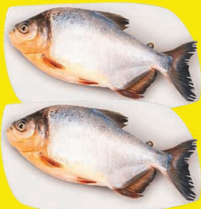
Tambaqui Cong. kg 23,89 , kg