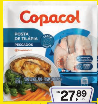
Posta de Tilápia Copacol Cong. 800g 27,89 , un. Pagando com VUONICARD 26,89 , un.