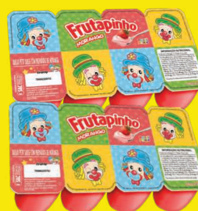
Petit Suisse Frutapinho 320g 6,98 , un.