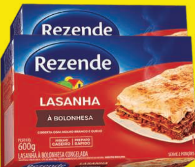
Lasanha Rezende 600g Sabores 13,90 , un.