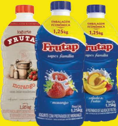
Iogurte Frutap 1,25kg Sabores 10,90 , un.