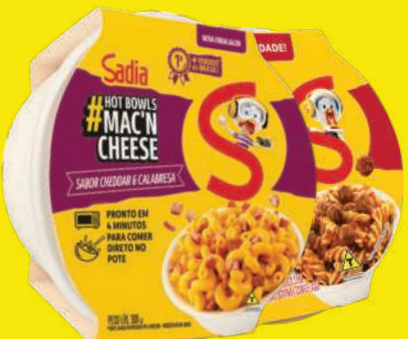
Mac'n Cheese Sadia 300g Sabores 10,89 , un.