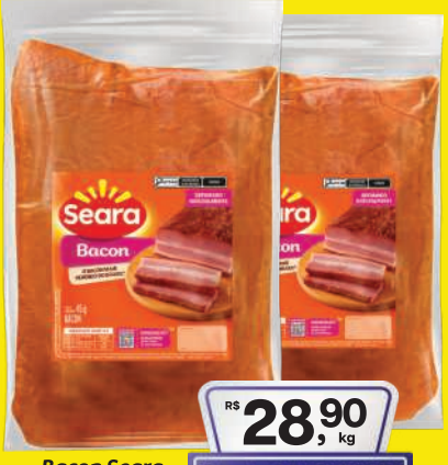
Bacon Seara Manta kg 28,90 , kg Pagando com VUONICARD 27,90 , kg