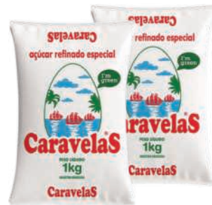
Açúcar Refinado Caravelas 1kg