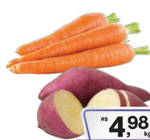
Cenoura ou Batata Doce kg

RS 3,78 kg Pagando com VUIONCARD RS 3,48 kg