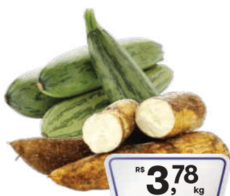
Abóbora Itália/Mandioca kg

RS 2,28 un. Pagando com VUIONCARD RS 1,98 un.