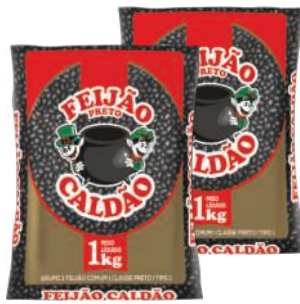
Feijão Preto Caldão 1kg