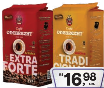
Café Odebrecht Tradicional/Extraforte Vácuo 500g

RS 16,98 un. Pagando com VUIONCARD RS 15,98 un.