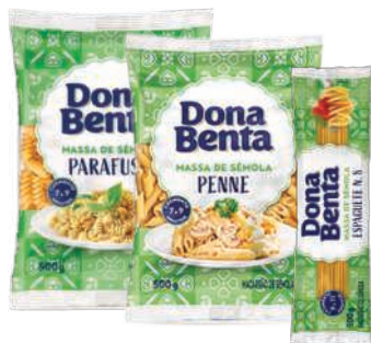
Macarrão Dona Benta Sêmola Espaguete/Parafuso/Penne 500g

RS 16,98 un. Pagando com VUIONCARD RS 15,98 un.