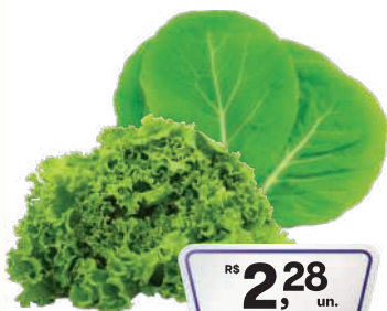
Alface Crespa/Couve Folha un.

RS 2,28 un. Pagando com VUIONCARD RS 1,98 un.