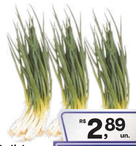
Cebolinha Mais Verde Maço

RS 2,89 un. Pagando com VUIONCARD RS 2,58 un.