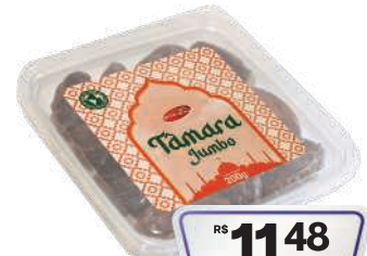
Tamara Garden Fruit 200g Jumbo

RS 5,98 un. Pagando com VUIONCARD RS 5,78 un.