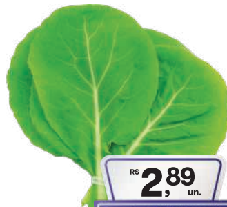
Couve Manteiga Maço

RS 2,89 un. Pagando com VUIONCARD RS 2,58 un.