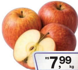
Maçã Gala Importada kg

RS 3,48 kg Pagando com VUIONCARD RS 2,99 kg