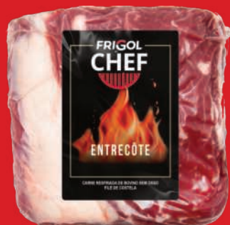
Entrecôte Frigol Chef Resfriado a Vácuo kg