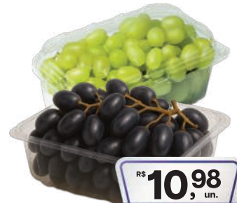
Uva Thompson/Vitória BF 500g

RS 4,99 un. Pagando com VUIONCARD RS 3,98 un.