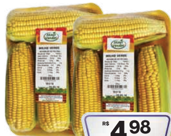
Milho Verde Bandeja 700g

RS 12,98 un. Pagando com VUIONCARD RS 11,98 un.