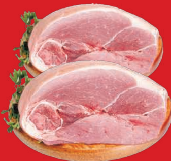
Pernil ou Paleta Suína c/ Osso e Toucinho kg

RS 11,48 un. Pagando com VUIONCARD RS 10,98 un.