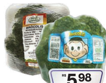
Brócolis Ninja Mais Verde/Turma da Mônica 250g

RS 4,98 un. Pagando com VUIONCARD RS 4,48 un.