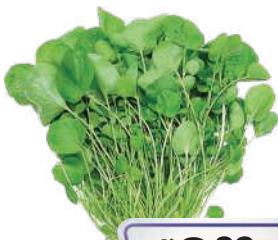
Rúcula Hidropônica Mais Verde un.

RS 2,89 un. Pagando com VUIONCARD RS 2,58 un.