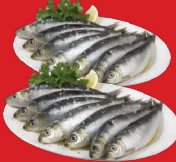
Sardinha Fresca kg