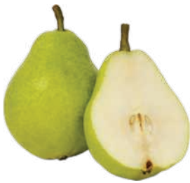
Pera Importada kg

RS 10,98 un. Pagando com VUIONCARD RS 9,98 un.