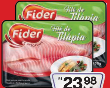
Filê de Tilapia Fider s/ Pele Resfriado Bandeja 400g

RS 23,98 un. Pagando com VUIONCARD RS 22,98 un.