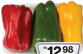
Pimentão Misto 450g

RS 2,89 un. Pagando com VUIONCARD RS 2,58 un.