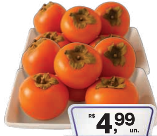
Caqui Rama Forte 500g

RS 7,99 kg Pagando com VUIONCARD RS 6,98 kg