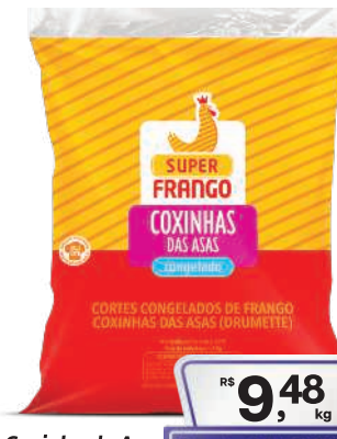
Coxinha da Asa Super Frango Congelada kg

RS 9,48, kg Pagando com VUIONCARD RS 8,98, kg