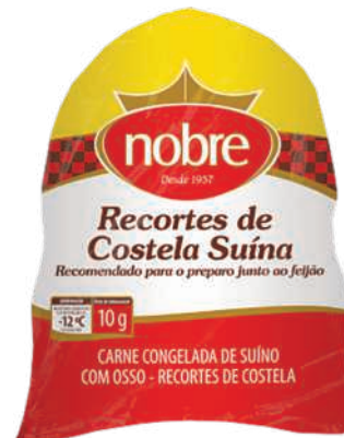
Recorte Costela Suína Nobre kg RS 6,98 , kg