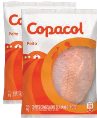
Peito de Frango Copacol Congelado Pacote kg RS 8,98 , kg

RS 9,48, kg Pagando com VUIONCARD RS 8,98, kg