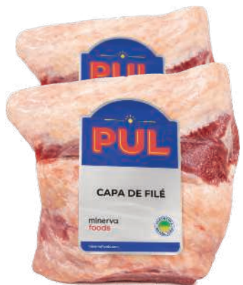
Capa de Filé Pul Bovino Congelado kg RS 29,90 , kg