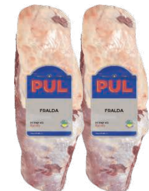
Fralda Bovina Pul Congelada kg RS 39,90 , kg