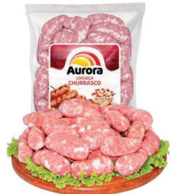
Linguiça Churrasco Aurora kg RS 16,98 , kg