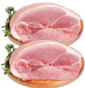
Perna ou Paleta Suína c/ Toucinho Resfriado kg RS 10,98 , kg