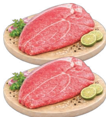
Patinho Bovino Pedaco kg RS 37,90 , kg