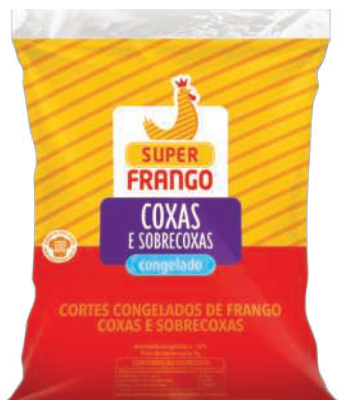
Coxa e Sobrecoxa Super Frango Congelado kg RS 6,38 , kg