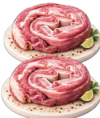
Costela em Tiras Bovina Resfriada kg RS 17,98 , kg

RS 17,98, kg Pagando com VUIONCARD RS 16,98, kg