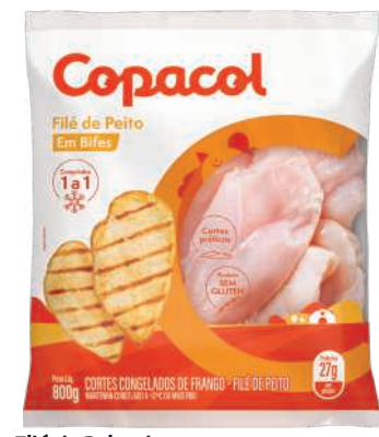
Filé de Peito de Frango Copacol IQF Congelado 800g RS 12,98 , un.