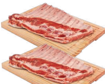
Costelinha Suína c/ Toucinho Bandeja kg

RS 17,98, kg Pagando com VUIONCARD RS 16,98, kg