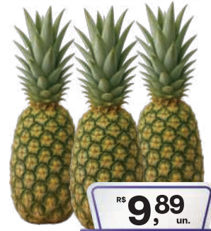
Abacaxi Pérola un.

RS 6,78 kg Pagando com VUIONCARD RS 5,98 kg