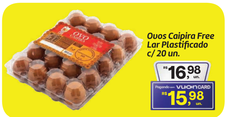
Ovos Caipira Free Lar Plastificado c/ 20 un.

RS 3,78 kg Pagando com VUIONCARD RS 3,29 kg