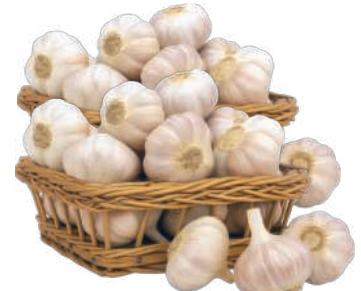
Alho Granel kg