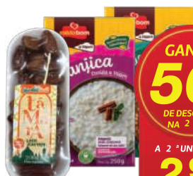
Tâmara Garden Fruit c/ Carço 200g/ Feijão Carioca Caldo Bom 250g/ Canjica Branca Caldo Bom 250g

GANHE 50% DE DESCONTO NA 2ª UN. A 2ª UN. SAI POR: 2,99 un. DO MESMO PRODUTO/ TIPO