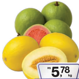
Melão Espanhol ou Goiaba Vermelha kg

RS 5,78 kg Pagando com VUIONCARD RS 5,48 kg