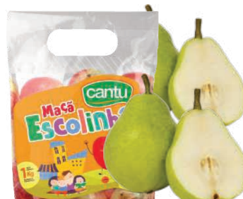
Pera Importada kg/ Maça Cantu Escolinha 1kg