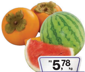
Melancia Baby/ Caqui Fuyu kg

CADASTRE-SE E RECEBA AS OFERTAS PELO WHATSAPP.