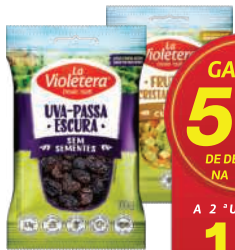
Frutas Cristalizadas La Violetera Cubos 150g/ Uva Passa Escura La Violetera 100g

RS 16,98 un. Pagando com VUIONCARD RS 15,98 un.