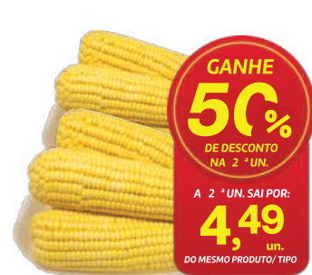
Milho Verde Bandeja un.

GANHE 50% DE DESCONTO NA 2ª UN. A 2ª UN. SAI POR: 4,49 un. DO MESMO PRODUTO/ TIPO