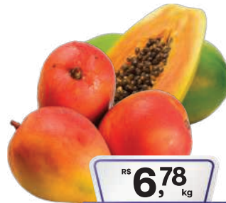
Mamão Formosa/ Manga Tommy kg

RS 5,78 kg Pagando com VUIONCARD RS 5,48 kg