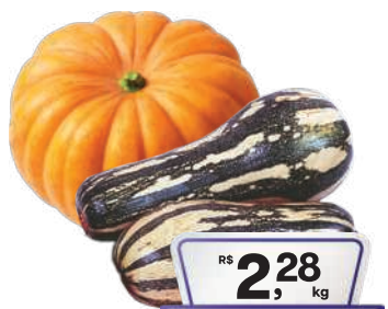
Abóbora Paulista/ Moranga kg

RS 9,89 un. Pagando com VUIONCARD RS 8,98 un.