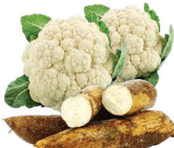
Couve Flor un./ Mandioca Cura kg

RS 2,28 kg Pagando com VUIONCARD RS 1,98 kg