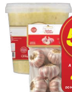
Alho Sabor Nobre 1,01kg/ Alho Cartela Sabor Nobre 200g

GANHE 50% DE DESCONTO NA 2ª UN. A 2ª UN. SAI POR: 4,99 un. DO MESMO PRODUTO/ TIPO